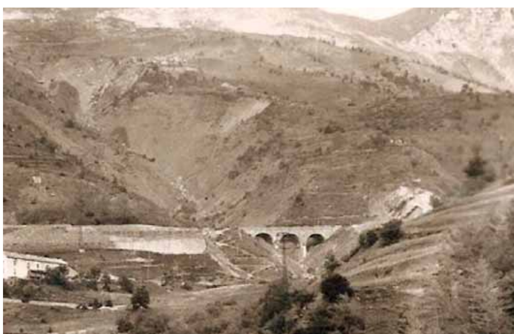
Il Rio della Cà ed il ponte storico, anni '50. (Fig. 14)