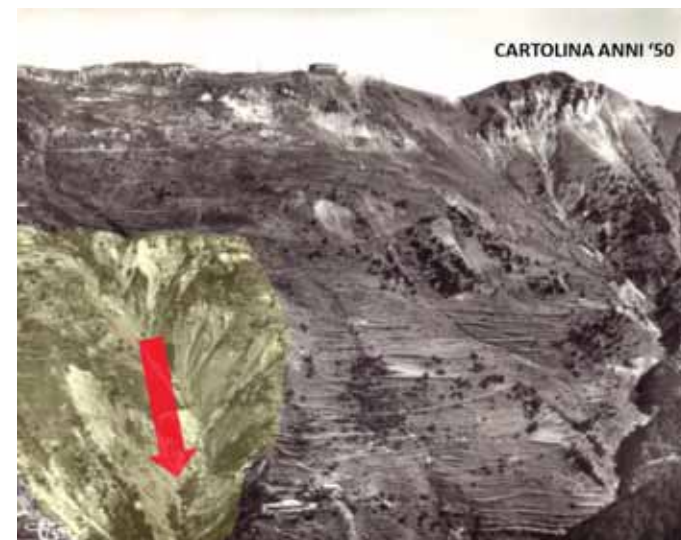
I versanti instabili del Rio della Cà in una cartolina degli anni '50. (Fig. 12)

Se poi consultiamo i documenti ufficiali francesi, vediamo che nel 2002 lo Studio realizzato nell'ambito delle azioni di servizio pubblico dal BRGM (Doc.01-RIS-325 BRGM/RP-51440-FR) intitolato "Mappatura dei movimenti del suolo in Val Roya - Alpi Marittime" indica come altamente a rischio i versanti del Rio della Cà.