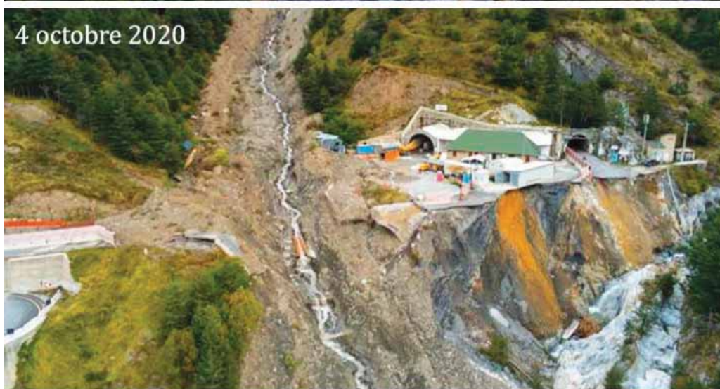
Le modificazioni dell'alveo del Rio della Cà ed i fenomeni di dissesto avvenuti tra il 3 ed il 4 ottobre. (Fig. 11)