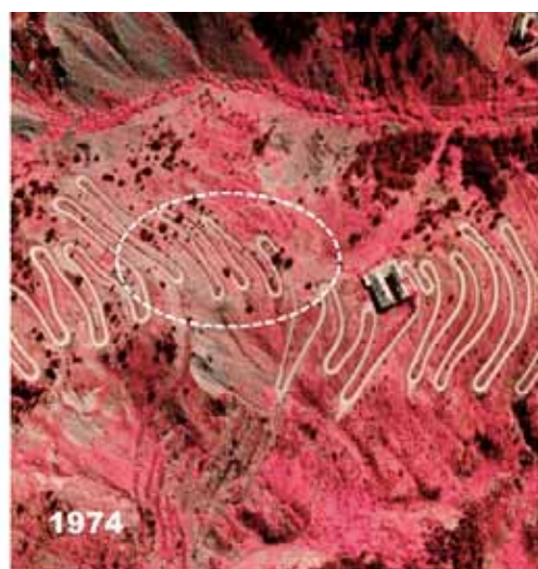
Esempio di modifiche di tracciato della strada che sale al Colle di Tenda, dovute all'instabilità dei versanti. (Fig. 10)